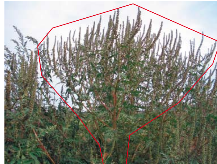
Typische breit ausladende, kerzenleuchterartige Wuchsform der Beifuß-Ambrosie bei freiem Stand (siehe Seite 2)

BAYERN | DIREKT ist Ihr direkter Draht zur Bayerischen Staatsregierung. Unter Tel. 089 122220 oder per E-Mail unter direkt@bayern.de erhalten Sie Informationsmaterial und Broschüren, Auskunft zu aktuellen Themen und Internetquellen sowie Hinweise zu Behörden, zuständigen Stellen und Ansprechpartnern bei der Bayerischen Staatsregierung.