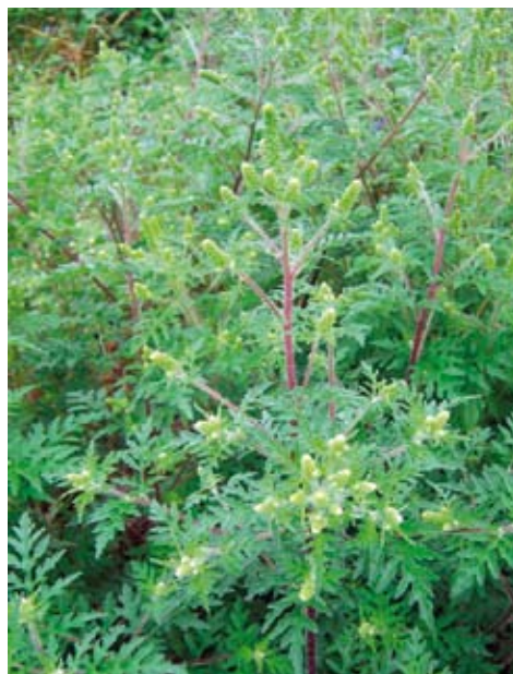
Beginnende Blüte (ab Mitte Juli)