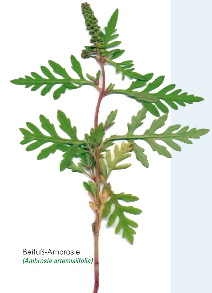
Beifuß-Ambrosie ( Ambrosia artemisiifolia )