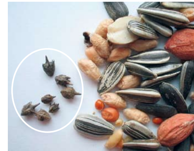
Ambrosia-Samen im Vogelfutter

Nach bisherigen Erkenntnissen wird Ambrosia überwiegend mit landwirtschaftlichen Produkten wie z.B. Vogelfutter nach Deutschland eingeschleppt. Mit Vogelfutter gelangt die Art häufig in Gärten oder auf Felder wie z.B. auf Schnittblumenfelder, von wo aus sie sich weiter ausbreiten kann. Häufig werden Ambrosia-Samen mit Erdmaterial oder anhaftend an Bau- und Landmaschinen bzw. PKW an neue Standorte verschleppt.