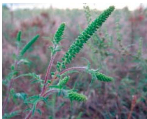
Vollblüte (August bis Oktober)