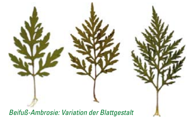
Beifuß-Ambrosie: Variation der Blattgestalt