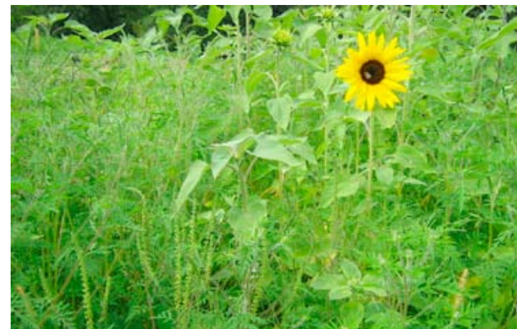
Ambrosia in Sonnenblumenfeld

Ambrosia-Vorkommen in der freien Landschaft sind von besonderer Bedeutung, weil sich die Art dort unbemerkt ausbreiten und große Bestände bilden kann.