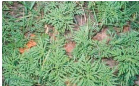
Ambrosia-Jungpflanzen (im Juni)