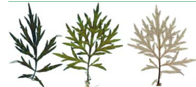
Gemeiner Beifuß: Oberseite grün, Unterseite silbrig